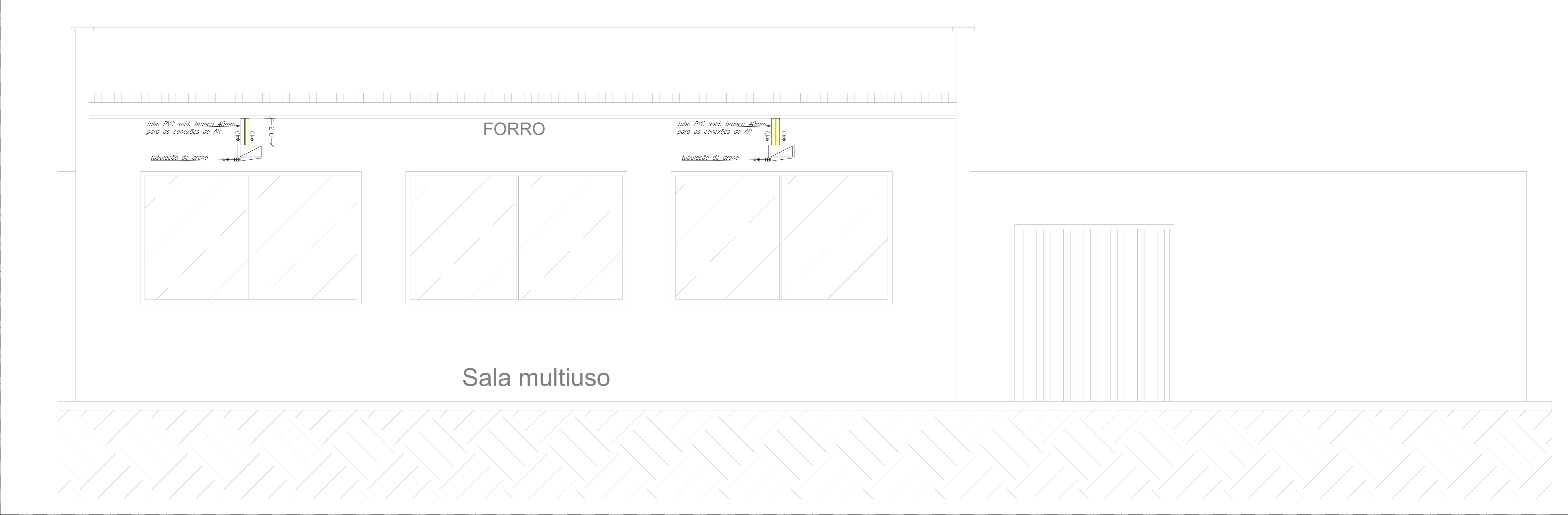
01 DETALHE 01 ESCALA: 1/25